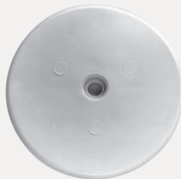
75毫米 (3 英寸) 固定塑料垫片