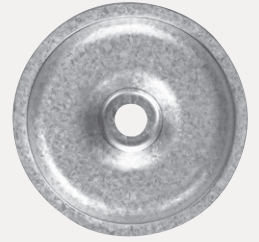
Placa de unión metálica de 50 mm (2-in.)

En las listas de Factory Mutual puede consultar estos productos con la referencia "2-in. Metal Seam Plate" y "3-in. Ribbed Galvalume Plate".